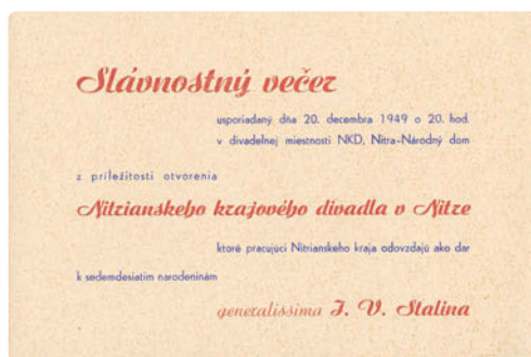
Pozvánka na otvorenie Nitrianskeho krajového divadla dňa 20. decembra 1949, pri príležitosti ktorého sa konal slávnostný program venovaný sedemdesiatym narodeninám generalissima J. V. Stalina.